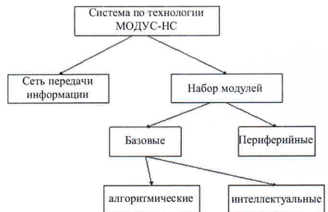
Рис. 1. Классификация компонентов в технологии МОДУС-НС

• интеллектуальные, содержащие фрагменты обученной ИНС.